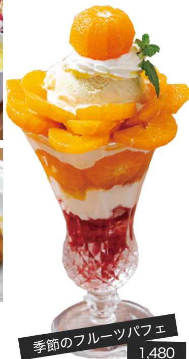
季節のフルーツパフェ 1,480