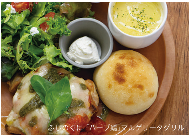
ふじのくに「ハーブ鶏」マルゲリータグリル