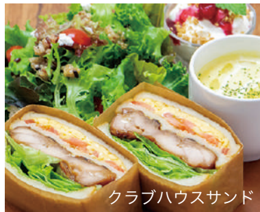
クラブハウスサンド