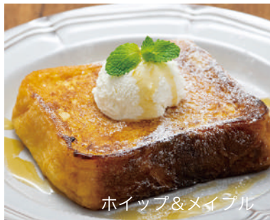
ホイップ&メイプル