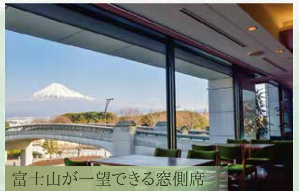
富士山が一望できる窓側席